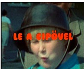
BÁDOGOS, BOGRÁCCSAL A FEJÉN