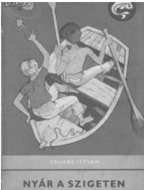
A régi kiadású könyv borítója

1. Sorold fel a főszereplőket! Írd melléjük, hogy kinek, mit kellett vinnie a táborozáshoz!