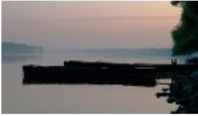
Hajnali Duna part

1. Milyen volt a hajnali Duna part? Írj ki néhány szót, szókapcsolatot!