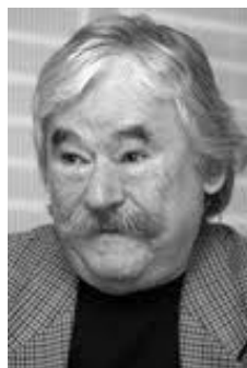
Csukás István József Attila és Kossuth-díjas magyar költő, író. Született: 1936. április 2. (életkor 77), Kisújszállás

Vakáció a halott utcában (Ez Rákospalotán játszódik.) http://www.youtube.com/watch?v=qHtkLRvbiYI